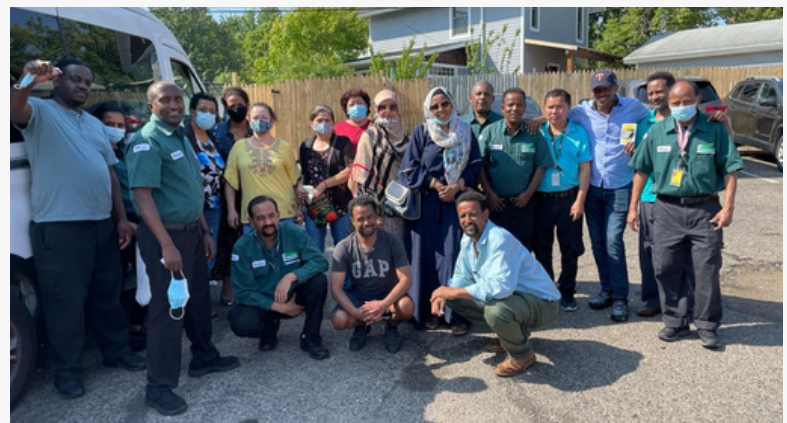
Despite threats from bosses, airport janitors refused to cross the picket line at MSP and joined window cleaners on the picket line throughout the strike.

The strike began Monday, August 16th and saw picket lines at various locations across Minneapolis and St. Paul, including the MSP Airport where dozens of airport janitors honored the picket line, with strong support from elected officials and community members. The contract covers over 40 workers at three companies (Columbia Building Services, Final Touch Commercial Cleaning and Apex North). Thank you to the window cleaners and all Local 26 members who came out in solidarity and showed the bosses once again that WHEN WE, FIGHT WE WIN!