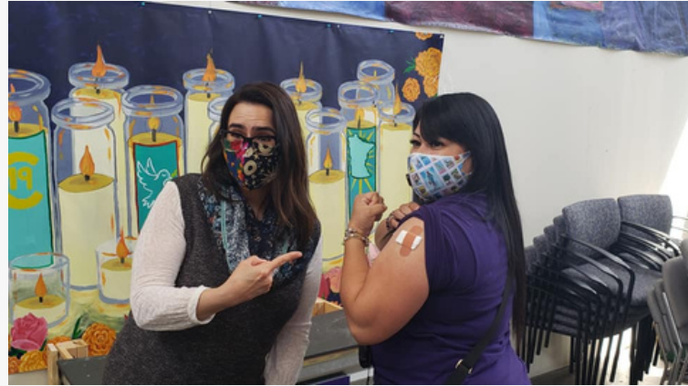
La vicegobernadora Peggy Flanagan y la vicepresidenta del Local 26, Eva López, posan para una foto en la clínica de vacunas.

• ¡El evento de vivienda el 14 de agosto ayudó a conectar a los miembros con programas para propietarios de viviendas nuevas y enlaces para asistencia con el alquiler!