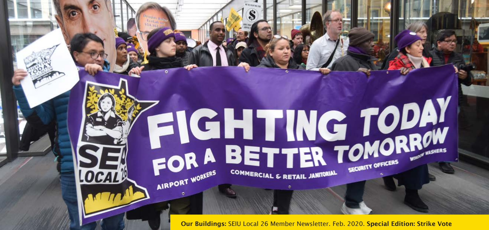
Our Buildings: SEIU Local 26 Member Newsletter. Feb. 2020. Special Edition: Strike Vote